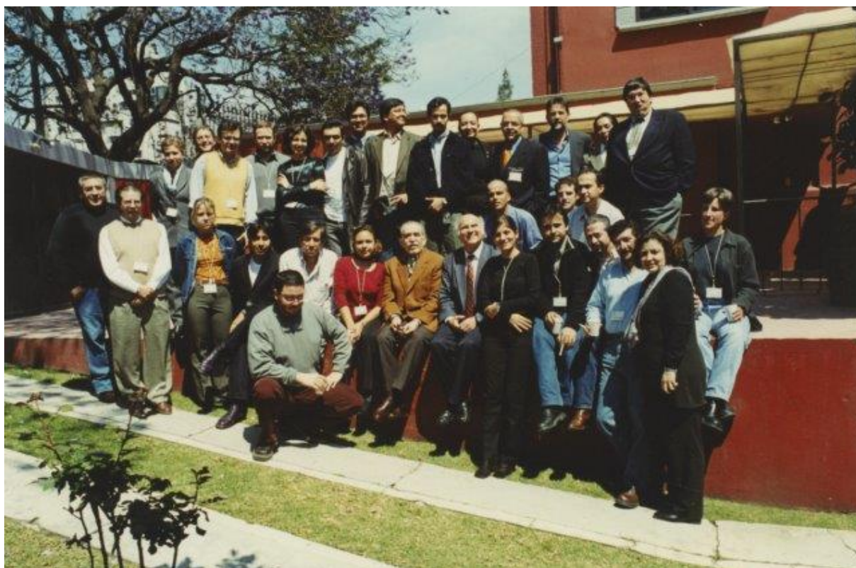
Meksyk 2001